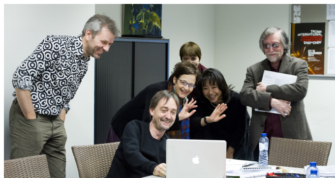
TROMP 2014 jury