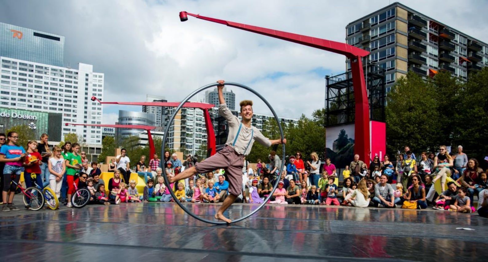
Rotterdam Circusstad op 24 uur cultuur 2014