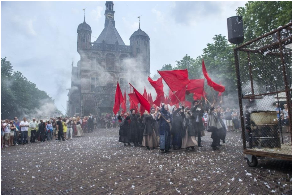
Teatro del Silencio - Deventer Op Stelten 2015

Gezelschappen komen graag naar Deventer om hun (nieuwe) voorstellingen, premières en speciale producties te spelen. Er wordt samengewerkt aan speciale projecten met gezelschappen uit geheel Europa, maar ook groepen uit bijvoorbeeld de VS en Australië.