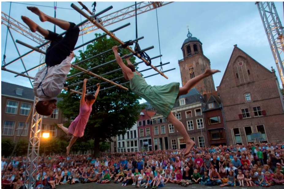
Ockham's Razor – Deventer Op Stelten 2012

Daarnaast kiezen we er in de komende jaren voor om (gratis) tickets in te zetten om publiek gericht uit te nodigen voor bepaalde voorstellingen, bijvoorbeeld artistiek inhoudelijk vernieuwende voorstellingen en voorstellingen waar enige voorkennis voor nodig is.