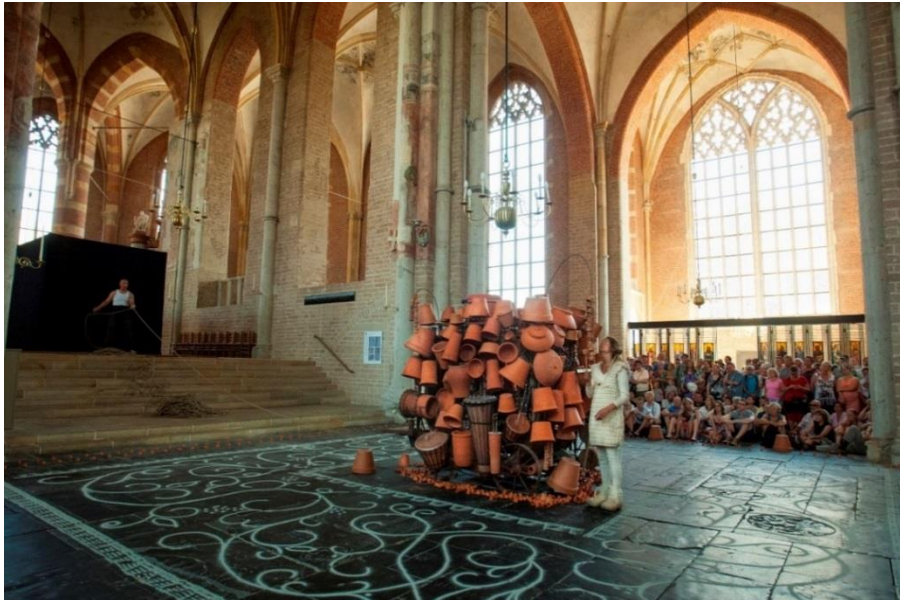
Tuig - Deventer Op Stelten 2013

De komende jaren zal dat worden voortgezet, maar willen we uitbreiden met speciale producties door jonge makers, al dan niet in combinatie met buitenlandse uitwisselingen en samenwerkingsprojecten.