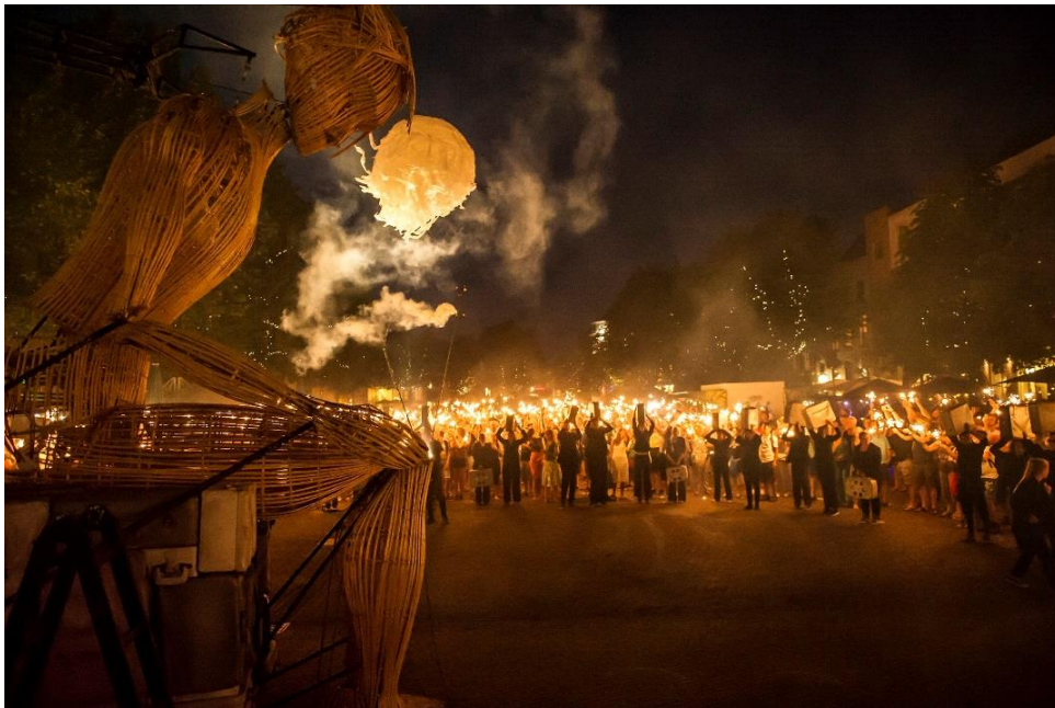
L'Homme Debout - Deventer Op Stelten 2015

Doordat de verdiepingsslag nadrukkelijk onderdeel zal zijn van de totaalbeleving van het festival, hebben wij er vertrouwen in dat ook de nieuwe voorstellingen en projecten goed zullen worden bezocht.