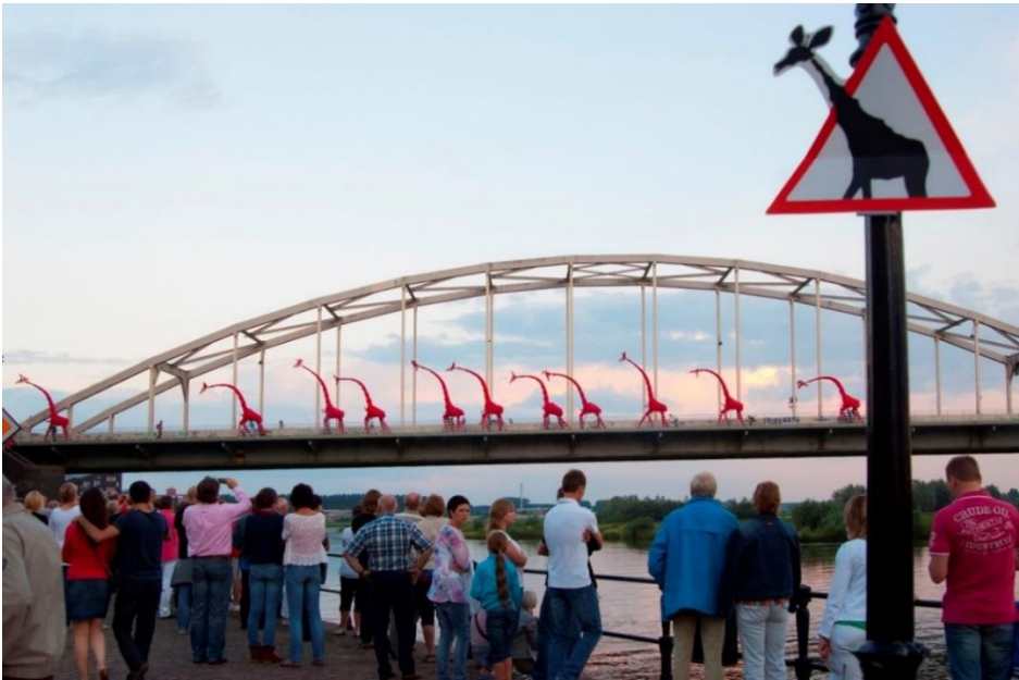
Les Girafes - Deventer Op Stelten 2012