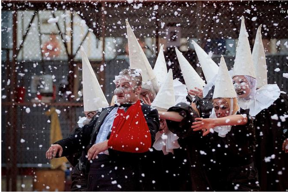
Teatro del Silencio - Deventer Op Stelten 2015