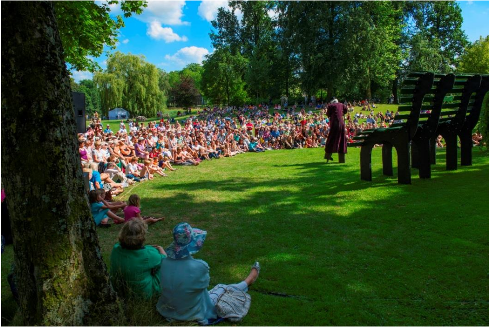
Rijsterborgherpark - Deventer Op Stelten 2014