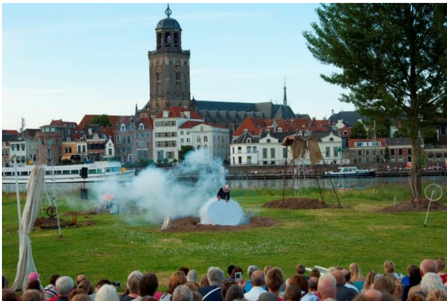
The Garden Project - Deventer Op Stelten 2012

'Deventer Op Stelten' wil de spin zijn in het culturele web van Oost-Nederland. Niet alleen door haar strategische ligging, maar bovenal door haar culturele tentakels binnen heel Oost-Nederland aan te bieden.