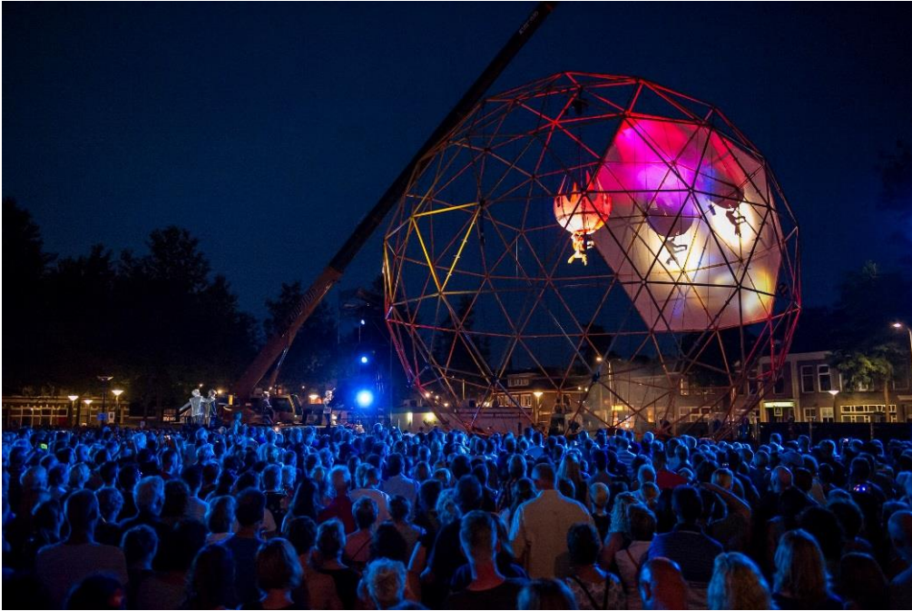
Close-Act - Deventer Op Stelten 2015