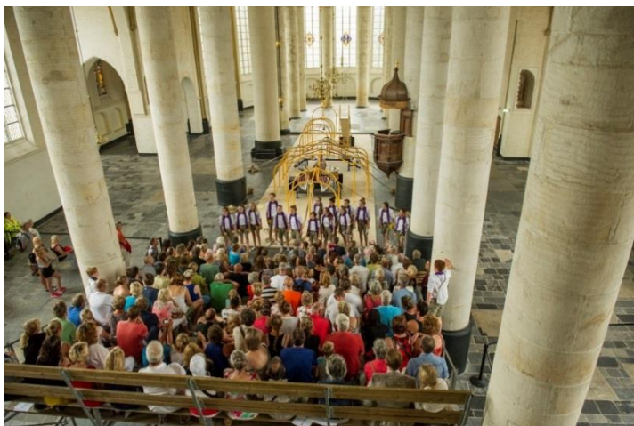
Bergkerk – Deventer Op Stelten 2015

Er zijn steeds meer bedrijven die als sponsor willen participeren, maar meer willen doen dan alleen geld beschikbaar stellen. Het festival ziet het als uitdaging om sponsorpakketten op maat en creatieve initiatieven, die passen bij het festival en bij het bedrijf verder uit te bouwen.