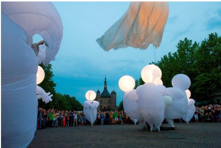
Cie de Quidams - Deventer Op Stelten 2015

Dit maatschappelijke draagvlak is een grote kracht van het festival. Het festival levert hiermee een grote bijdrage aan de sociale en maatschappelijke cohesie.