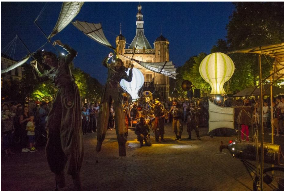
Remue Ménage – Deventer Op Stelten 2015

Het bestuur is verantwoordelijk voor de organisatie, financieel beheer en risicobeheer en verantwoordelijk voor het functioneren van de directie.