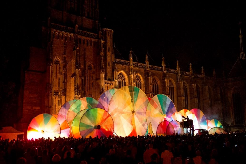
Compagnie Off – Deventer Op Stelten 2014