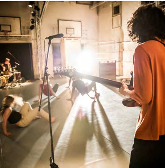
The Basement - Halle Ostkreuz, Berling (DE)

De Dansers herneemt voorstellingen, om altijd voor alle leeftijden een voorstelling op het repertoire te hebben. Ook bewijzen eerdere ervaringen met internationaal tourende voorstellingen ( Droomstad , Tetris ) dat er meerdere seizoenen nodig zijn om mee te draaien in de dynamiek van internationale festivals. Uit het vorige kunstenplan herneemt De Dansers drie voorstellingen: