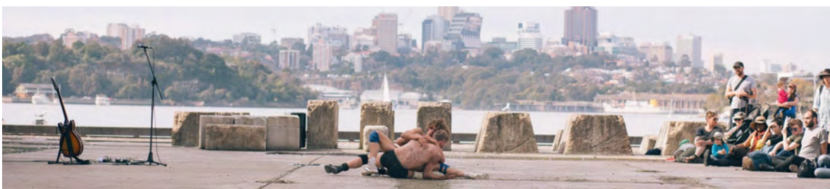
Betonder - Underbelly Arts Festival Sydney (AUS)

Door de samenwerking met Theater Strahl en het gezamenlijk optrekken in de acquisitie wordt er veel in Duitsland gespeeld en heeft De Dansers daar ook een stevig netwerk. In het Verenigd Koninkrijk en Ierland bouwt De Dansers een netwerk op dat in 2016 voor het eerst wordt aangesproken voor een tournee, om vervolgens uitgebouwd te worden: Fringe en Imagine Festival Edinburg, The Unicorn en Dance Umbrella London, Baboro Festival in Galway (IE). Met Cheryle Hansen van agentschap Kid's Entertainment (USA) onderzoekt De Dansers momenteel de Amerikaanse afzetmarkt.