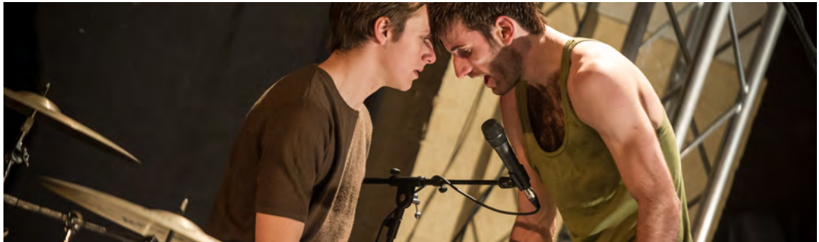
The Basement - Halle Ostkreuz, Berlin (DE)

In voorstellingen van De Dansers komen dans en muziek gelijkwaardig samen in een uitingsvorm tussen dansvoorstelling en concert. De spelers staan op de vloer als een band van dansers en muzikanten, die samen een gesamtkunstwerk bouwen. De Dansers kiest voor deze combinatie van disciplines omdat ze elkaar versterken. De dans belichaamt, materialiseert, gaat op de huid zitten. Muziek intensiveert en voegt een verdiepende emotionele laag toe, die resoneert in het gehoor, het geheugen en de onderbuik. Daarbij is muziek voor publiek dat onbekend is met dans vaak een toegangspoort om dans beter te begrijpen. De gemeenschappelijke basis om met deze disciplines het podium te delen is dit: de muziek en dans communiceren op hetzelfde niveau, wanneer ze een pure uiting van emotionele beleving zijn.