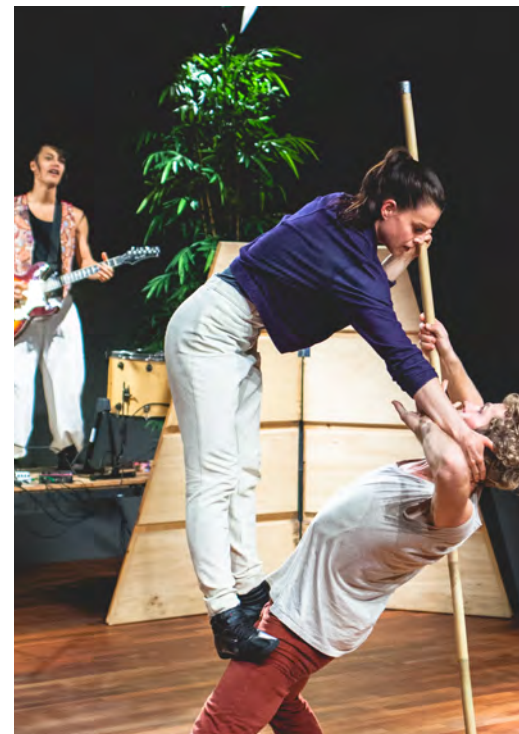
Pokon - Theater Kikker, Utrecht (NL)