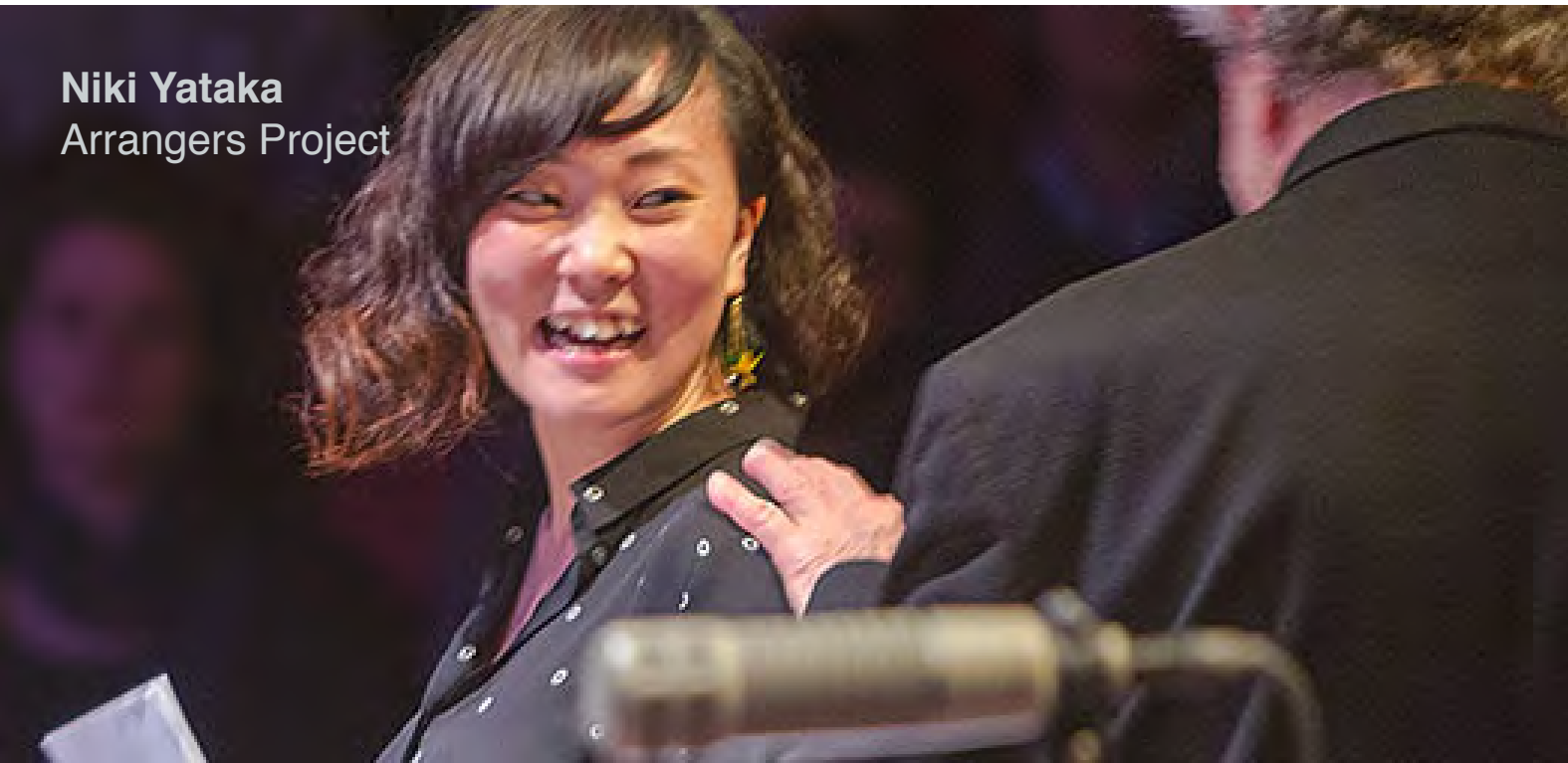
Niki Yataka Arrangers Project