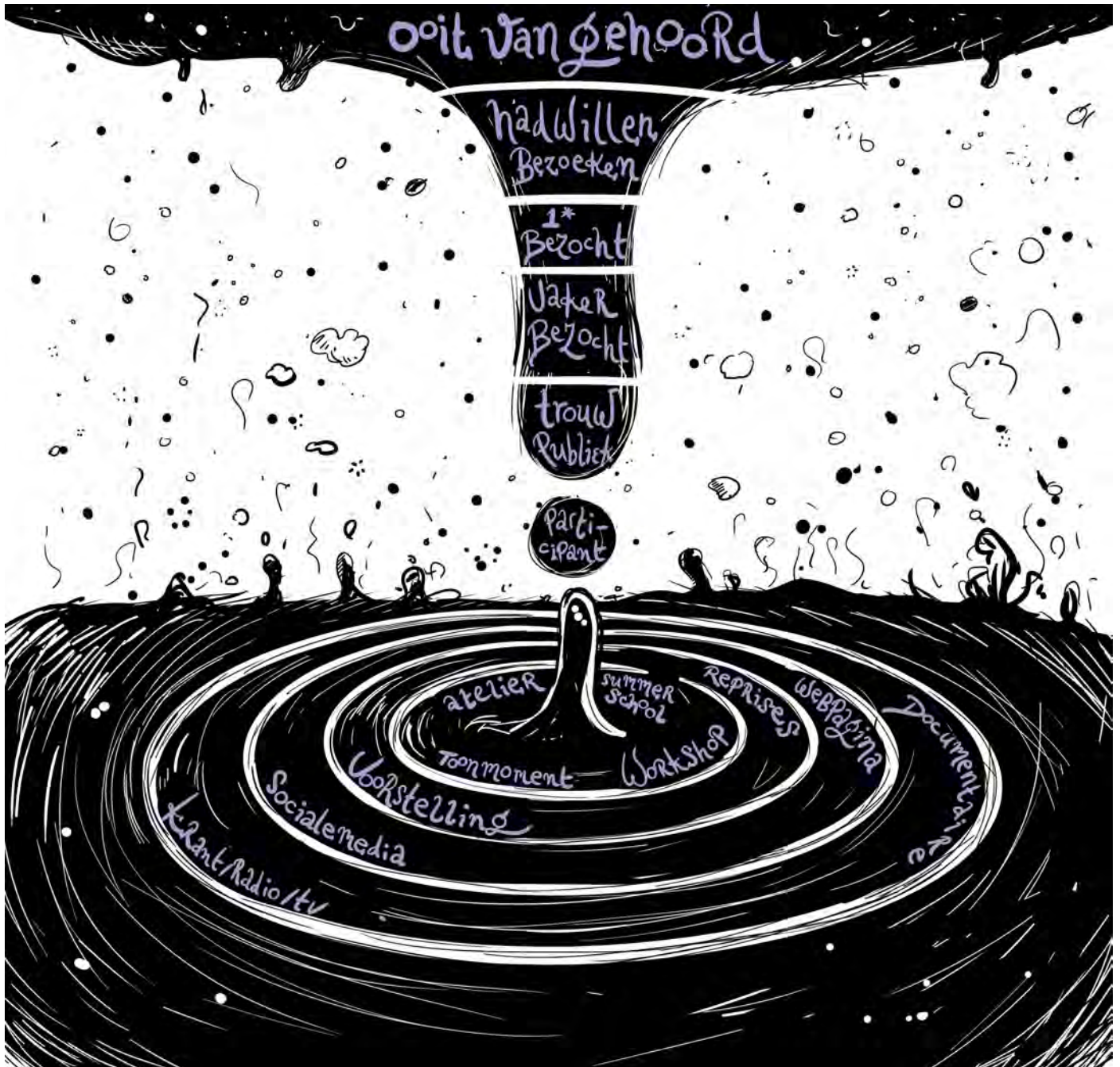
tekening Bas Köhler

Toonaangevende internationale kunstfestivals en -manifestaties hebben groeiende interesse voor Schweigman&. We bouwen verder aan bestaande relaties voor nieuwe coproducties (bijvoorbeeld Norfolk & Norwich Festival in Engeland in samenwerking met Leeuwarden Culturele Hoofdstad 2018). Daarnaast ontwikkelen we nieuwe relaties in Europa en verder weg, via het krachtige internationale netwerk van zakelijk leider Rachel Feuchtwang.