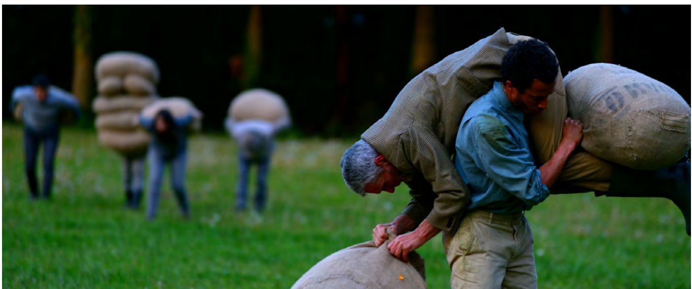
Erf (2015)

Reprises zorgen voor een langere speeltijd van voorstellingen waarvoor meer vraag dan ruimte is binnen het oorspronkelijk tourschema, met name ook in het buitenland. Voorstellingen (inclusief de nieuwe) worden - waar mogelijk - reisbestendig gemaakt, wat betekent dat zelfstandige crews de productie kunnen uitvoeren. Na de première worden deze aangeboden voor internationale speelbeurten (al dan niet in aangepaste versie) en een of twee jaar later speelt de voorstelling weer in Nederland. Met uitzondering van Curve en Erf spelen alle andere reprises in het kleine/middelgrote circuit.