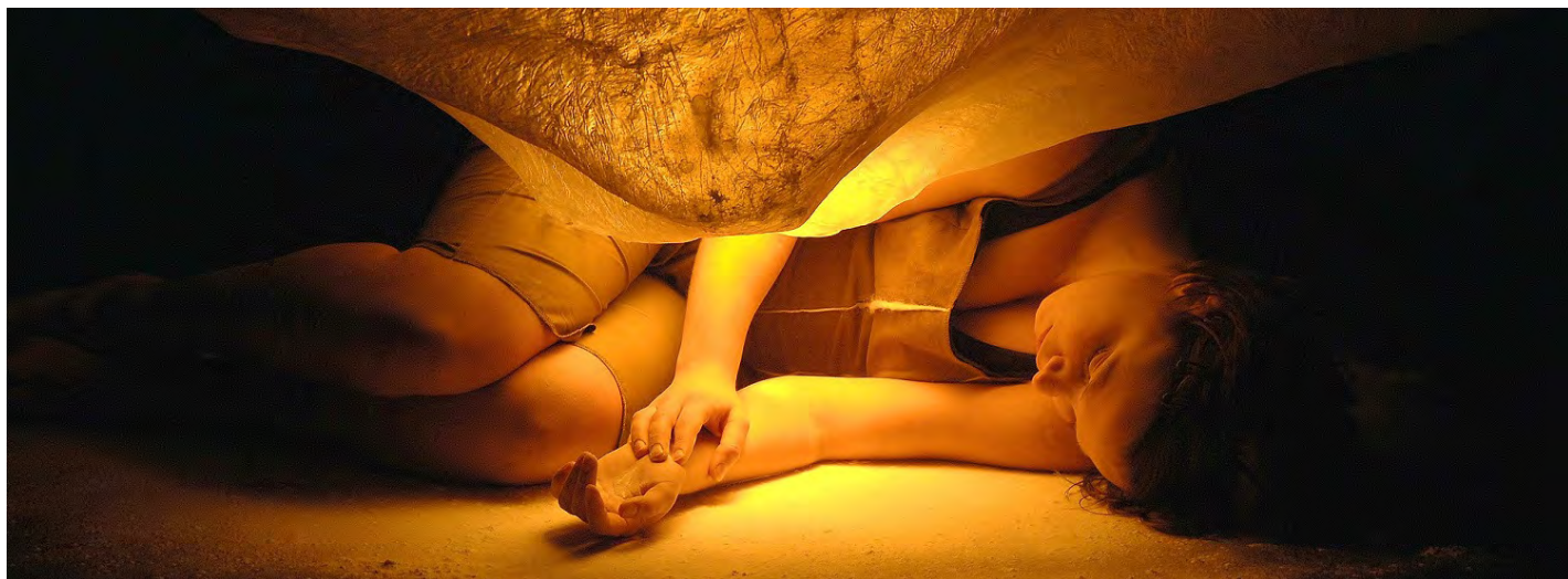
Universum (2014)

Het werk van Schweigman benadrukt het belang van onze fysieke aanwezigheid en de bijbehorende sensitiviteit. Ons lichaam – wijzelf in ervaarbare vorm – is het eerste, primaire, meest archetypische fenomeen. Dit onderwerpen we aan de fenomenen die ons omringen. De performers én de toeschouwers worden uitgedaagd zichzelf fysiek-zintuiglijk open te stellen. Door dit proces leren we onszelf kennen en de mogelijkheden om vanuit onszelf, ons lichaam, contact te maken met de ander of de omgeving. Dit thema lijkt in onze beeldschermcultuur te worden ondergesneeuwd, maar wij zijn ervan overtuigd dat hier een sterke behoefte aan is.