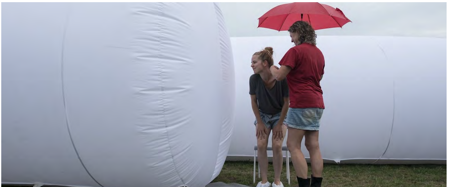
Curve (2015)